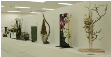
※写真は過去開催時の出品の様子です。