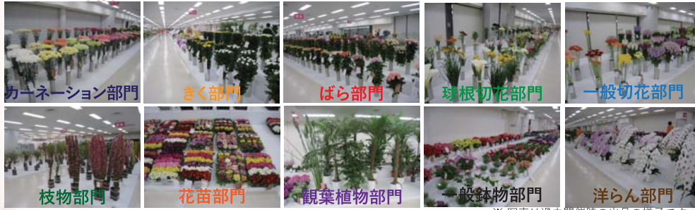
※写真は過去開催時の出品の様子です。