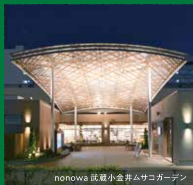
nonowa 武蔵小金井ムサコガーデン