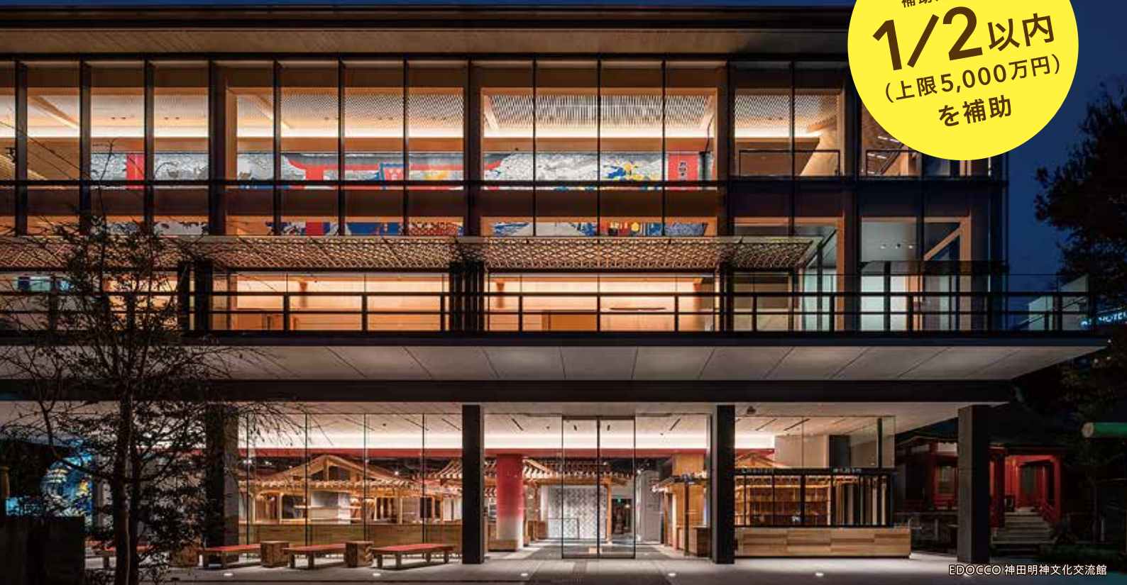
ED@CCO 神田明神文化交流館