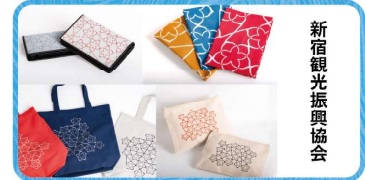
新宿観光振興協会