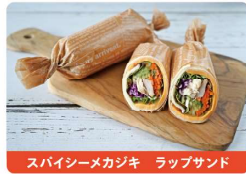
スパイシーメカジキ ラップサンド