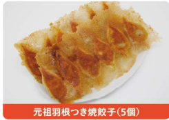
元祖羽根つき焼餃子(5個)