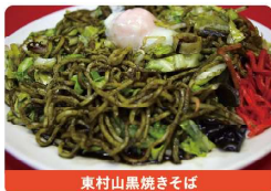
東村山黒焼きそば